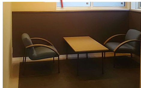
高齢者や障害者にもやさしい商談スペースを1Fに