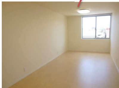
3Fの事務所は、昼間はとても明るい空間です